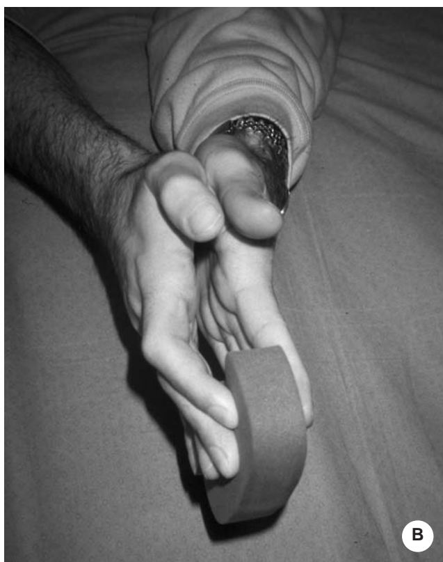
Figura 3. Caso 3. A) Sezione da taglio del flessore profondo e superficiale 2° e 3° dito, palmare lungo, flessore radiale del carpo, sezione del nervo mediano. B) Esercizi con spessori in polimero. C) Esercizi con fascia theraband.