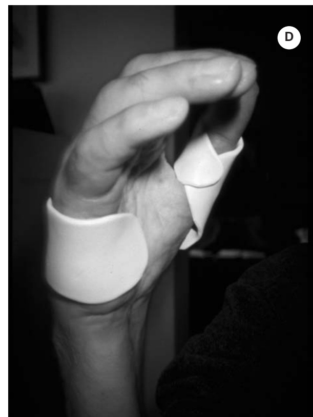
Figura 2. Caso 2. A) Lesione da taglio sezione dei flessori superficiali e profondi del 2°, 3°, 4° e 5° dito, sezione dei nervi ulnare e mediano. B) Primo tutore confezionato a 3 mesi dalla tenorrafia primaria. C, D) Il tutore dinamico consente un miglioramento dell'escursione articolare a livello delle MF.